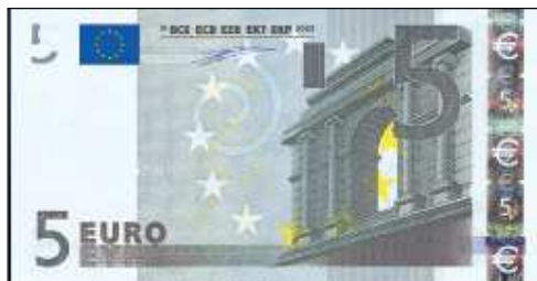
Entwurf von Robert Kalina 5 € Schein

Die Baukunst der Antike teilt sich ursprünglich in drei Hauptordnungen auf : die dorische, die ionische und die korinthische. Sie nimmt ihren Ausgang in der griechischen Kunst und setzt sich in der römischen fort. Der Kontrast zwischen den Kunstrichtungen ist gewollt, um eine ästhetische Wirkung hervorzurufen. Die Gebäude, Säulengänge und Monumentalportalen der griechischen Tempelanlagen werden häufig in weißem Marmor ausgeführt; die architektonischen Formen wie Friese und Ornamente tragen lebhafte Farben