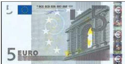
Billet de 5 Euros Motif de Robert Kalina

L'art antique se décompose en cinq ordres : toscan, dorique, ionique, corinthen et composite. Il prend naissance dans l'art grec et se perpétue dans l'art romain.