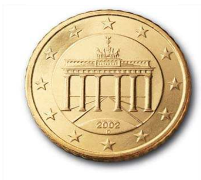
Motif de Reinhard Heinsdorff Pièces de 10, 20 et 50 cents

Entourée des douze étoiles de l'Europe, la Porte de Brandebourg est surmontée du quadrigue de la Victoire, char attelé à quatre chevaux de front. Six colonnes doriques supportent l'entablement. Elles ouvrent la porte vers un horizon où convergent les lignes de perspective, issues d'un soleil levant. La Porte de Brandebourg domine la célèbre avenue berlinoise Unter den Linden qui signifie « sous les tilleuls ».